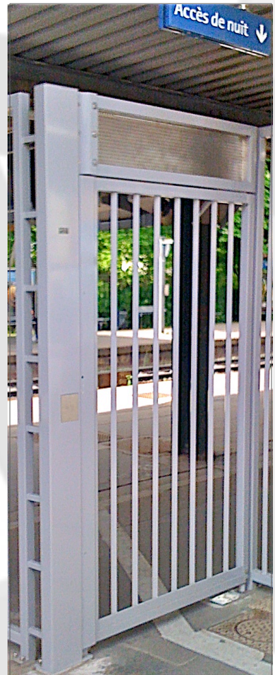
Porte d'Accès de Nuit (P.A.N.) ® Réseau RER

Travaillant en étroite collaboration avec de grandes entreprises du secteur, soucieuses de bénéficier d'un service complet, STOL se diversifie grâce à une équipe de 3 personnes, dédiée exclusivement aux opérations d'installation et de maintenance.