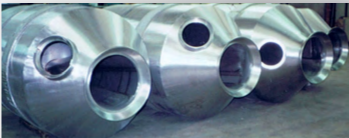
Malaxeurs à viande