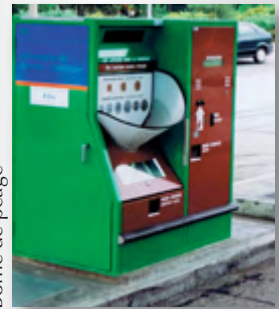
Borne de péage