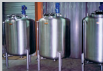
Cuves de traitement